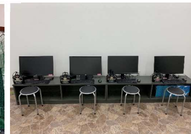
③フライトシミュレータ